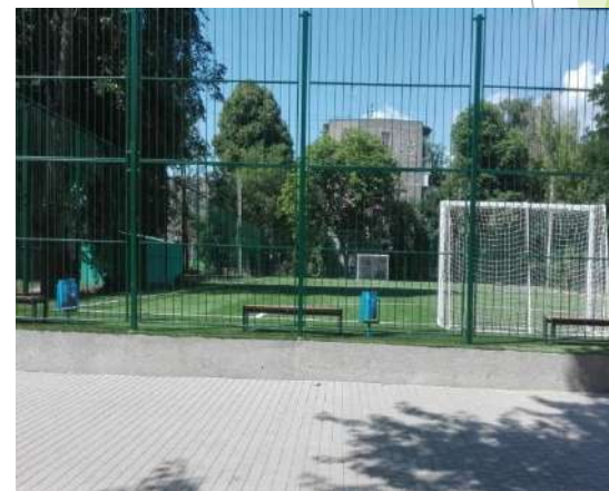
вул. Вітрука, 31