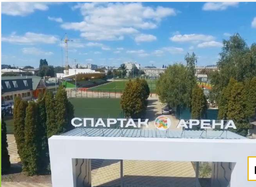
вул. Київська, 51