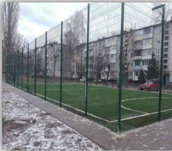
вул. Вітрука, 41-43