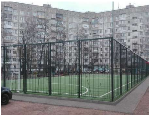
вул. Бориса Тена, 100-102