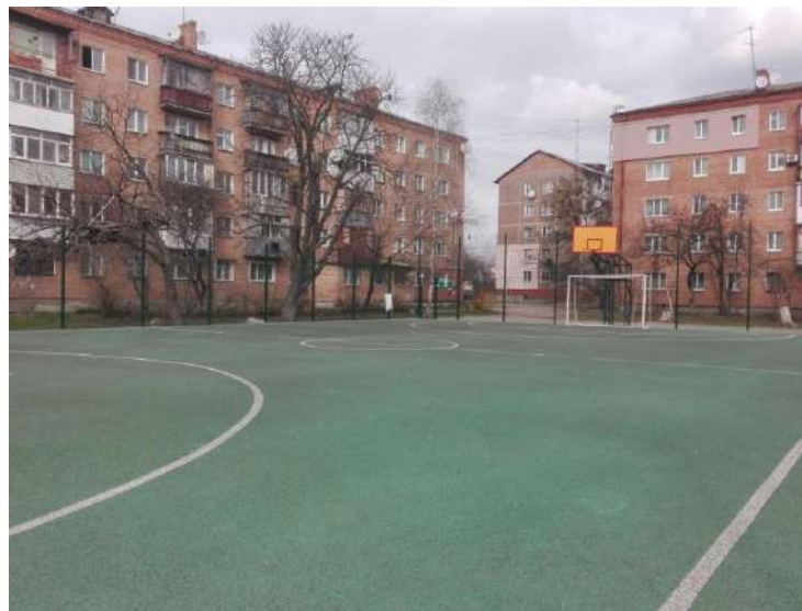
вул. Київська, 59