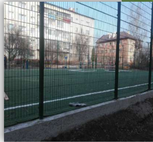
пров. Сікорського, 4