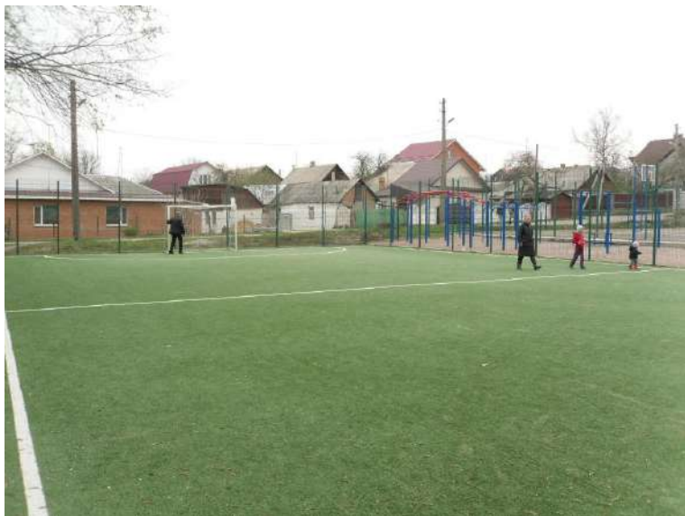
пров. 2-й Чехова, 14