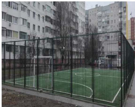
вул. Отаманив Соколовських, 7