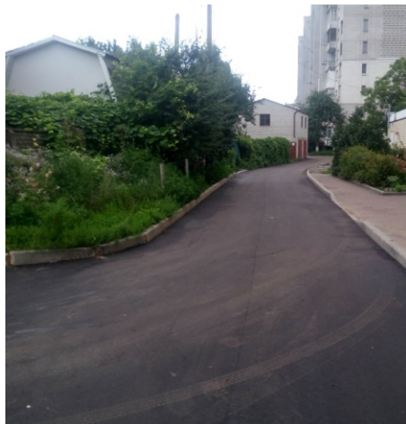
вул. Князів Острозьких 104/110