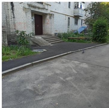
вул. Князів Острозьких 98