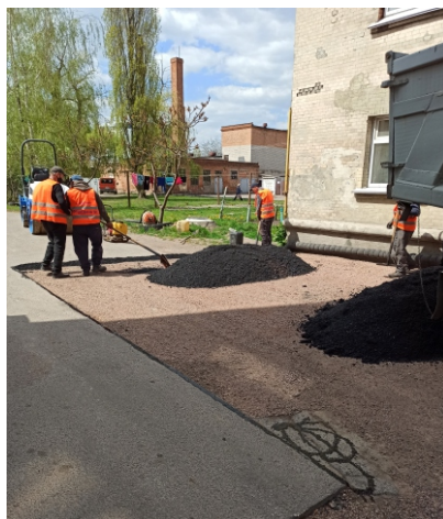
вул. Київська 65