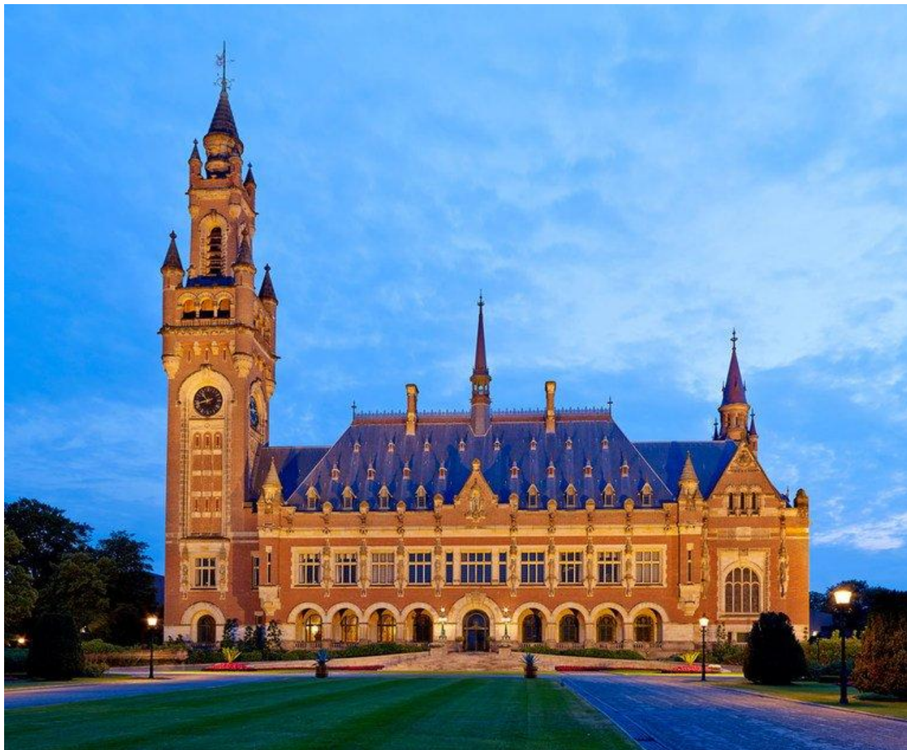
Будівля Міжнародного суду ООН, Гаага, Нідерланди. (прим. - ЮрФем)

фінансуванням тероризму від 1999 року шляхом підтримки, фінансування, озброєння тощо збройних угруповань, що здійснюють контроль над частинами Донецької та Луганської областей.