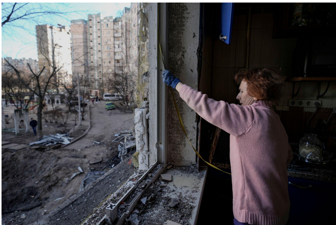
Жінка міряє вибите вікно у пошкодженій бомбардуванням будівлі, Київ, 21 березня 2022 року. (прим. - ЮрФем)

Аналіз проблеми. Загальний огляд. Російська агресія супроводжується завданням надзвичайно великої шкоди як населенню, так і цивільним об'єктам та інфраструктурі. У вересні 2022 року уряд України спільно зі Світовим Банком оцінював лише прямі майнові збитки в розмірі 326 млрд дол. США 99 . Ця сума ще підлягатиме уточненню, однак остаточна оцінка розміру майнової і немайнової шкоди точно буде вищою за сотні мільярдів доларів США.