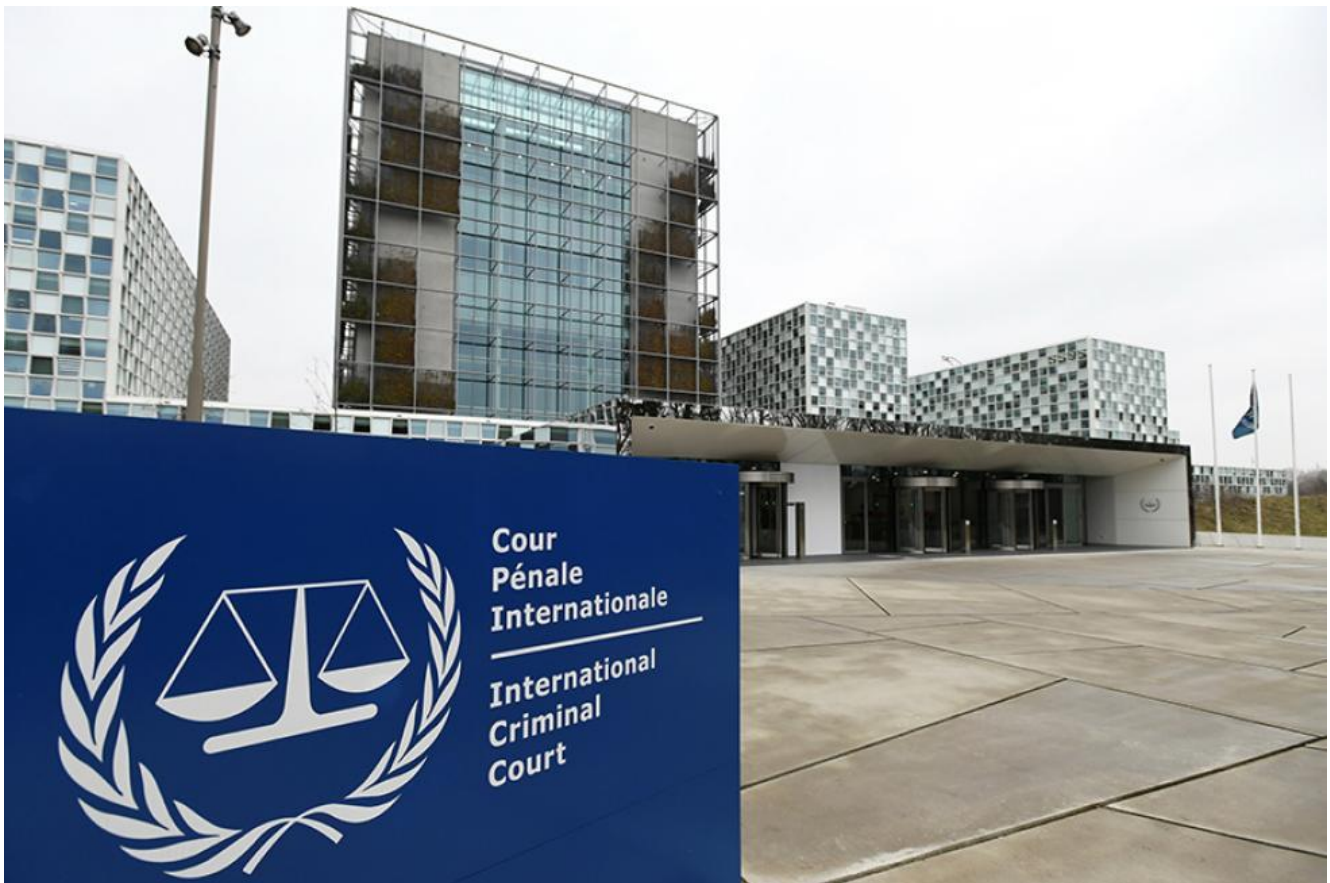
Будівля Міжнародного кримінального суду, Гаага, Нідерланди. (прим. - ЮрФем)

МКС, що створений на основі Римського статуту (далі – РС), компетентний розслідувати міжнародні злочини та притягати до кримінальної відповідальності осіб, винних у їх вчиненні. Загалом предметна юрисдикція МКС поширюється на злочин геноциду, злочини проти людяності, воєнні злочини та злочин агресії.