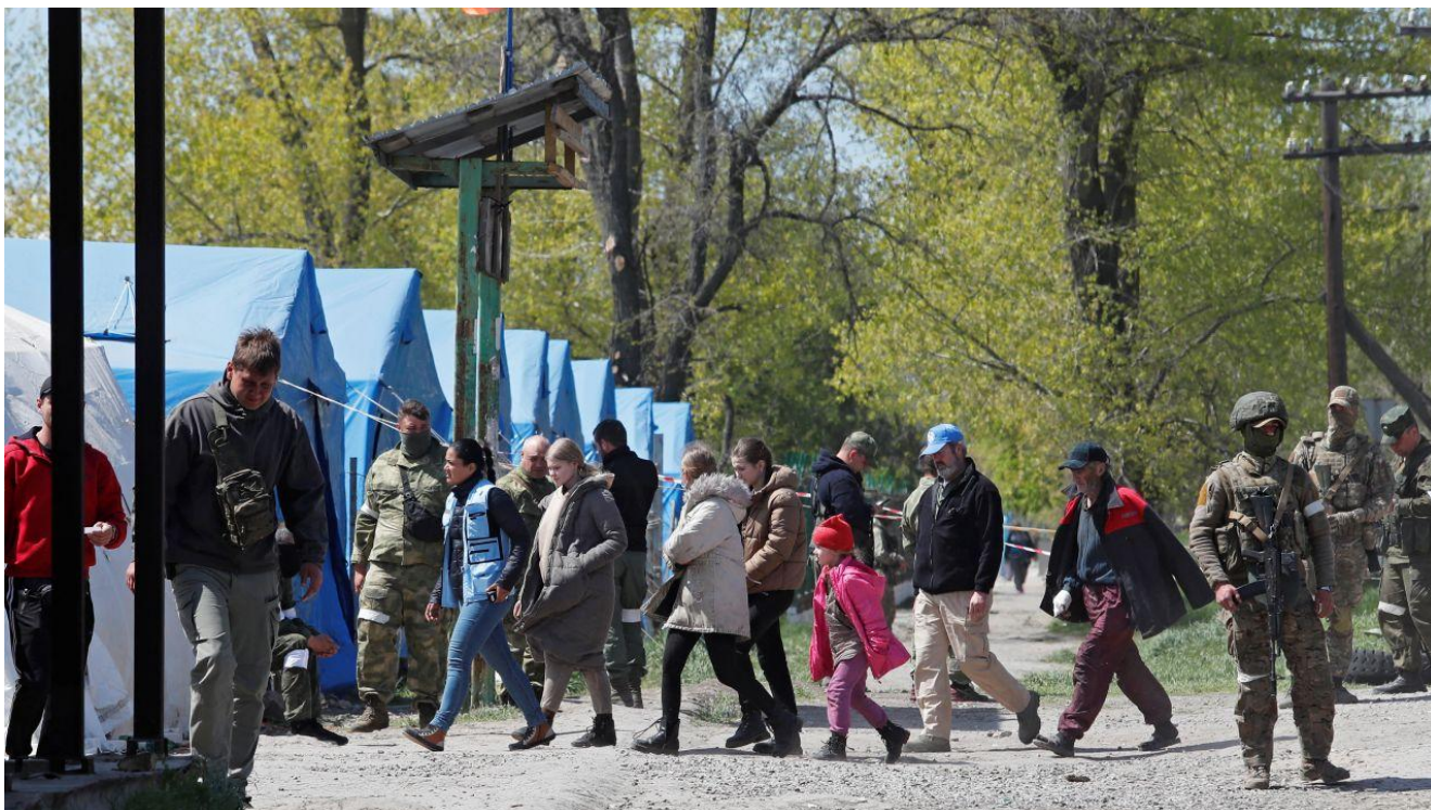
Евакуйовані з Маріуполя (Донецька область) мирні жителі прибувають у російський фільтраційний табір у Безіменному (Донецька область) на сході України 1 травня 2022 року. (прим. - ЮрФем)

Згідно з частиною 1 статті 49 Женевської конвенції про захист цивільного населення під час війни забороняється, незалежно від мотивів, здійснювати примусове індивідуальне чи масове переселення або депортацію осіб, що перебувають під захистом, з окупованої території на територію окупаційної держави або на територію будь-якої іншої держави, незалежно від того, окупована вона чи ні. І хоча згідно з частиною 2 цієї статті окупаційна держава може здійснювати загальну або часткову евакуацію з певної території, таке переміщення має бути необхідним для забезпечення безпеки населення або зумовлено особливо вагомими причинами військового характеру. Проведення таких евакуацій не може передбачати