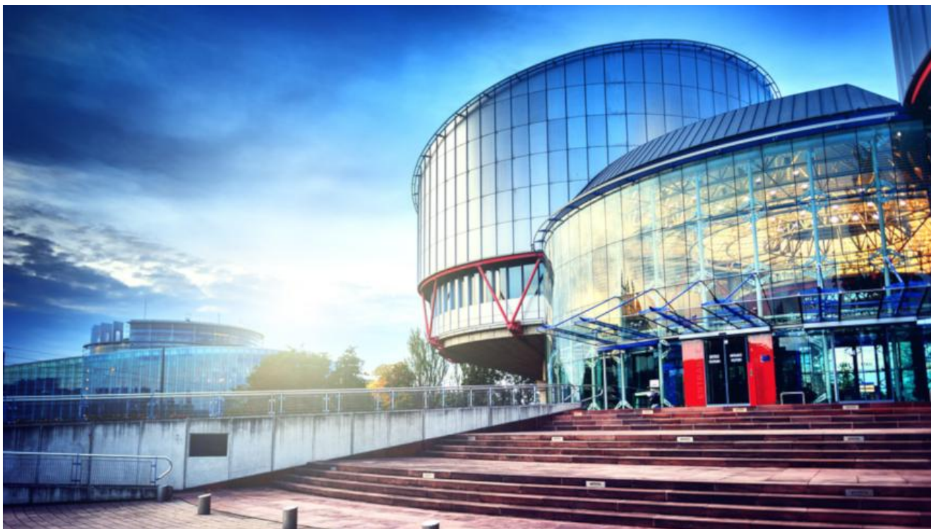
Будівля Європейського суду з прав людини, Страсбург, Франція. (прим. - ЮрФем)

широкомасштабного нападу на цивільне населення, такі діяння будуть також кваліфіковані як злочини проти людяності відповідно до статті 7 РС. Юрисдикція МКС в українському контексті також поширюється на злочин геноциду, який може вчинятися, зокрема, шляхом сексуального насильства.