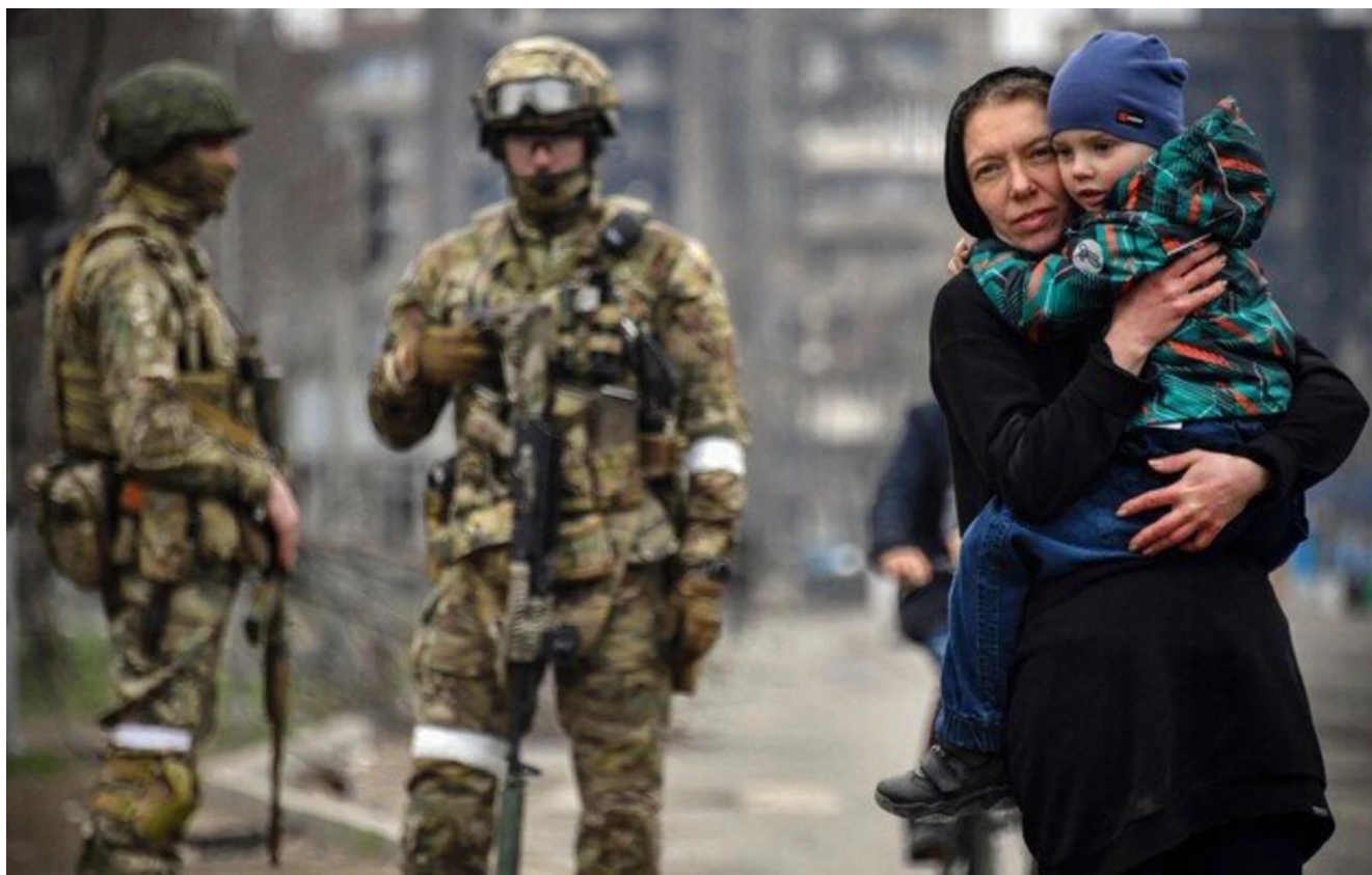
З моменту незаконного захоплення території, місцеві жителі підлягають перевірці з боку росіян. Це називається «фільтрацією». (прим. - ЮрФем)

(3) Фільтраційні табори – це місця (наметові містечка, приміщення шкіл чи інших закладів), де представники окупаційної влади утримують і перевіряють громадян України.