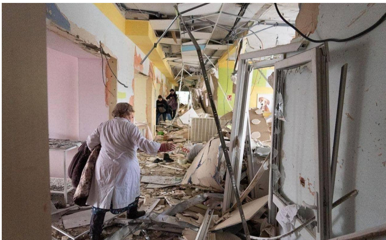
Наслідки обстрілу дитячої лікарні та пологового будинку в Маріуполі (Донецька область), 9 березня 2022 року. (прим. - ЮрФем)

9 березня 2022 року російські окупаційні війська відкрили вогонь з артилерії по Маріуполю. Обстрілами зруйновано пологовий будинок № 2 119 .