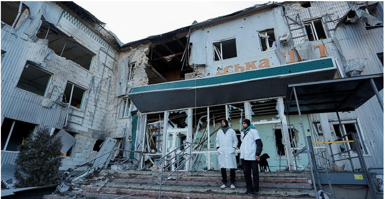
Зруйнована Волноваська центральна районна лікарня у м.Волноваха (Донецька область). (прим. - ЮрФем)

Досліджено випадки порушення права жінок на медичну допомогу в умовах воєнного часу з проєктуванням на концепцію медичного нейтралітету, констатовано порушення її принципів, зокрема доступності та гуманізму. Відзначено, що порушення принципів медичного нейтралітету є воєнним злочином за частиною 2 (b) статті 8 Римського статуту Міжнародного кримінального суду, а також те, що навіть в умовах воєнного часу конституційне право на охорону здоров'я, медичну допомогу та медичне страхування в Україні не обмежено, що дозволяє кожній жінці в повному обсязі здійснювати свої права, якби не протиправні дії агресора. Проаналізовано окремі державницькі заходи, які покликані максимально сприяти в здійсненні права жінок на медичну допомогу в Україні, зокрема ліквідуючи негативні наслідки збройного конфлікту.