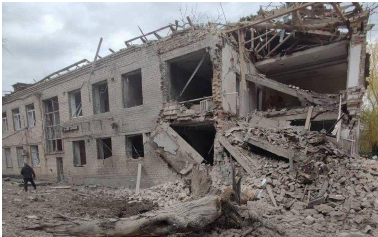
Обстріл лікарні у Баштанці (Миколаївська область). (прим. - ЮрФем)

Європи рекомендує урядам країн-членів гарантувати, аби безпека пацієнтів стала наріжним каменем усіх відповідних стратегій у сфері охорони здоров'я. Доступ до надійної системи охорони здоров'я – це базове право кожного громадянина усіх країн-членів 126 .