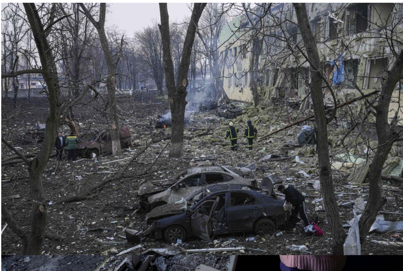
27 березня 2022 року українські ДСНСники працюють у постраждалому від обстрілів пологовому будинку Маріуполя (Донецька область). (прим. - ЮрФем)

Висновки та рекомендації. Питання руйнувань цивільних об'єктів та подальшого відшкодування за них є надзвичайно гендерно чутливим. Узагальнений підхід, без врахування потреб жінок, чоловіків та дітей, не забезпечить ані комплексного, ані вчасного відшкодування збитків. Попри те, що міжнародні стандарти в цій сфері ще напрацьовуються, уже існують прецеденти відшкодування, позитивні сторони й недоліки яких потрібно враховувати під час вирішення питання щодо відшкодування завданої російською агресією шкоди Україні.