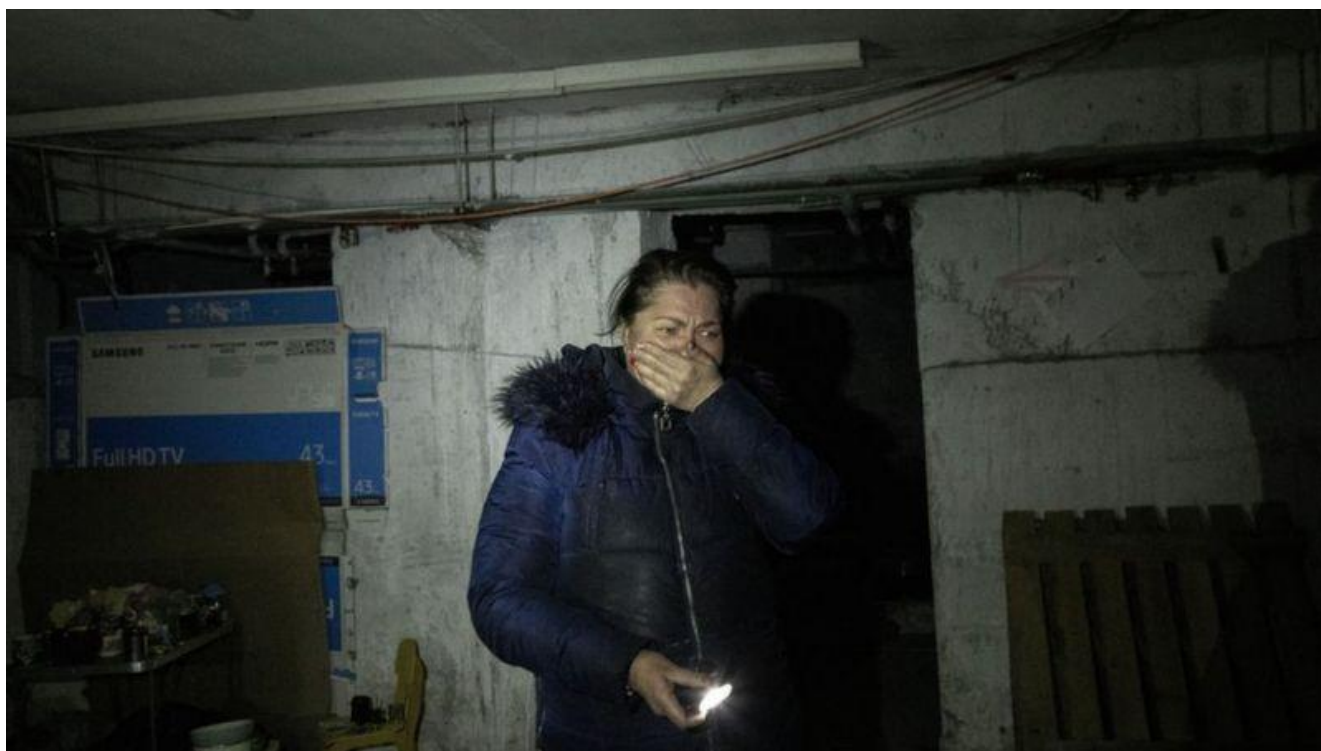
Жінка закриває рот рукою від побачених наслідків злочинних діянь армії рф у підвалі в Бучі (Київська область). (прим. - ЮрФем)

У цій публікації звернено увагу на поширеність вчинення сексуального насильства під час збройних конфліктів. Проаналізовано можливості використання результатів судової експертизи при доказуванні сексуального насильства, вчиненого в ході повномасштабної збройної агресії російської федерації проти України. Зокрема, йдеться про висновки експертів як докази вчинення сексуального насильства під час конфлікту в Міжнародному кримінальному суді та судах національної юрисдикції. Виявлено окремі проблеми національної правової системи щодо використання результатів судової експертизи.