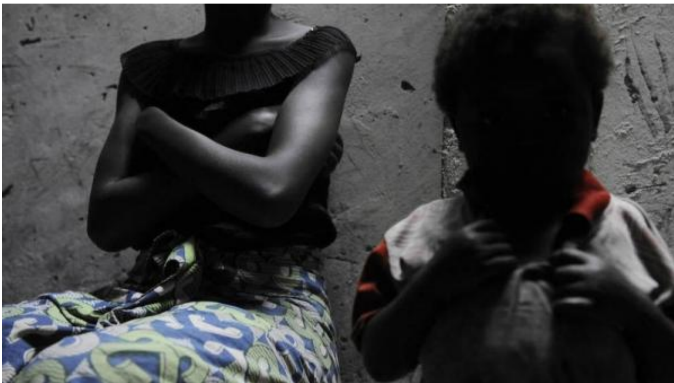
Жінки та діти, що зазнали сексуального насильства, пов'язаного з конфліктом, відчувають постійну провину та ганьбу. (прим. - ЮрФем)

гарантувати особам ефективні засоби правового захисту (remedies), зокрема відшкодування шкоди, репарації (reparation), у випадку порушення їхніх прав. Ця вимога стосується також випадків, коли шкода була завдана самими державами чи їхніми посадовими особами.