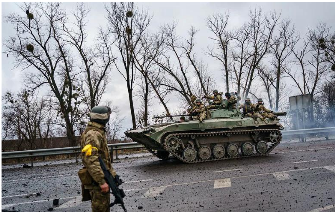
Українська військова техніка проїжджає по магістральній дорозі с. Ситняки (Київська область) для захисту Києва, Україна, 3 березня 2022 року. (прим. - ЮрФем)

Вступ. Збройна агресія російської федерації (далі – рф) щодо України розпочалась 19 лютого 2014 року 1 . Протягом перших восьми років цього збройного конфлікту (війни) відбулась анексія Автономної Республіки Крим та окупація значної частини Донецької і Луганської областей. У межах цього періоду російські військовослужбовці та представники т. зв. ДНР / ЛНР, які є квазіутвореннями під ефективним контролем росії, вчиняли воєнні злочини (порушували закони і звичаї війни). Водночас масштаби таких злочинів уже затьмарені воєнними злочинами рф, вчиненими після 24 лютого 2022 року – дати повномасштабного вторгнення в межах російсько-української війни.