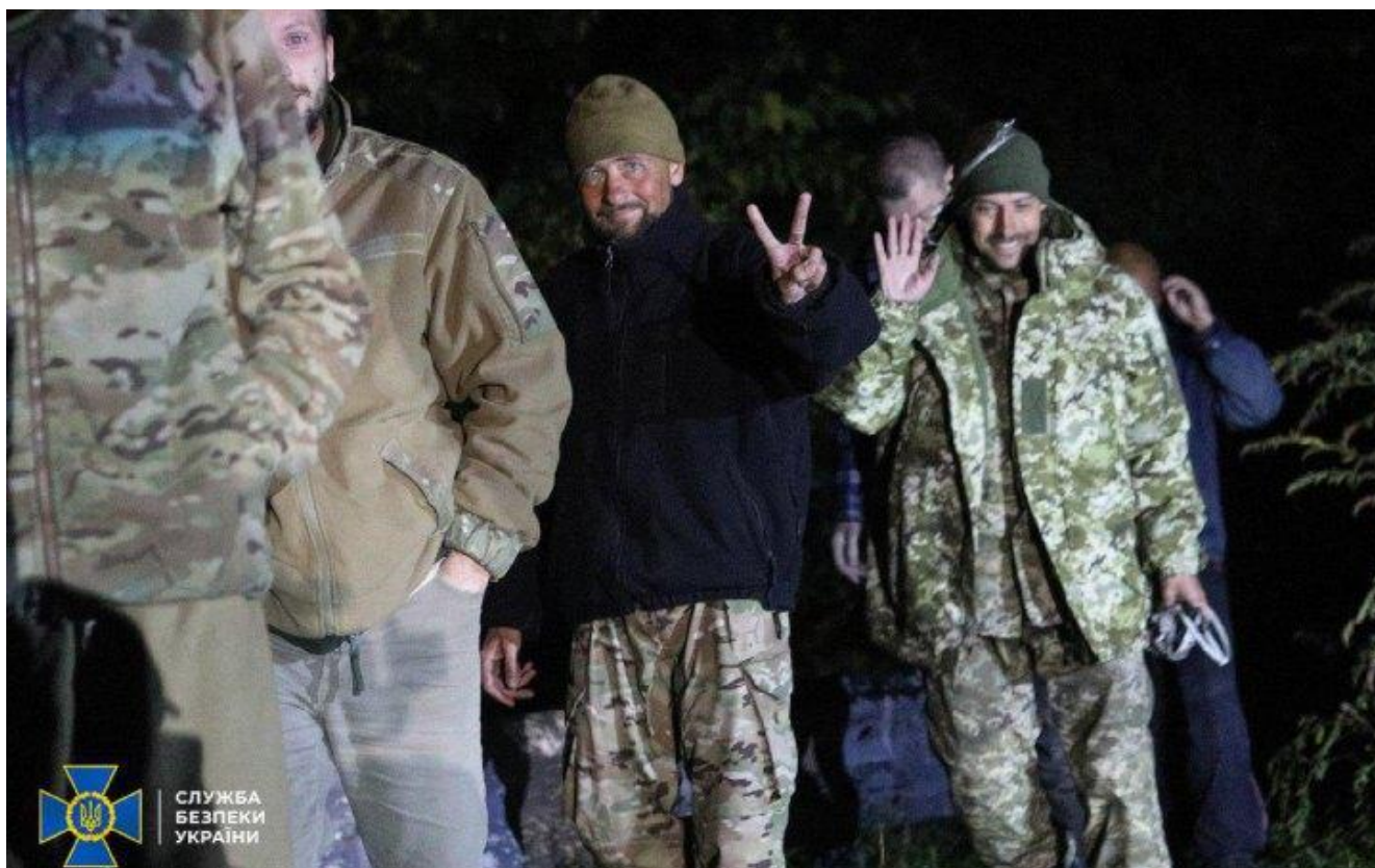
Українські військовослужбовці після звільнення з російського полону, 21 вересня 2022 рік. (прим. - ЮрФем)

1) російські війська систематично порушують принципи (розрізнення, пропорційності, належної обачливості, гуманності) і норми міжнародного гуманітарного права щодо методів і засобів ведення бойових дій, поводження з військовополоненими, цивільним населенням і цивільними об'єктами. Зокрема, використовують заборонену зброю та зброю невибіркової дії (наприклад, кластерну, запалювальну, термобаричну зброю і протипіхотні міни) у цивільних поселеннях;